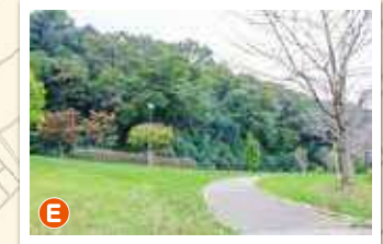
【見沼区八景】染谷ふるさとの緑の景観地