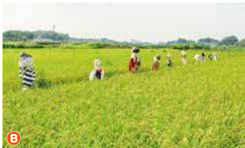
【見沼区八景】見沼代用水東縁と加田屋の田んぼ(9月)