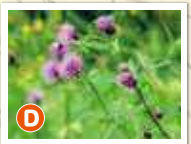
【見沼区八景】見沼代用水東縁とヒガンバナ(9月)・ノアザミ群生地(5月)