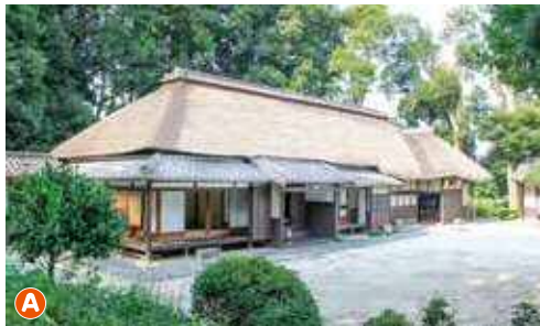
旧坂東家住宅 見沼くらしっく館